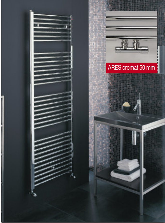
In fotografie: Calorifer Ares Cromat. Înălțime mm 1720, lățime 600, culoare Cromat (cod. 50).