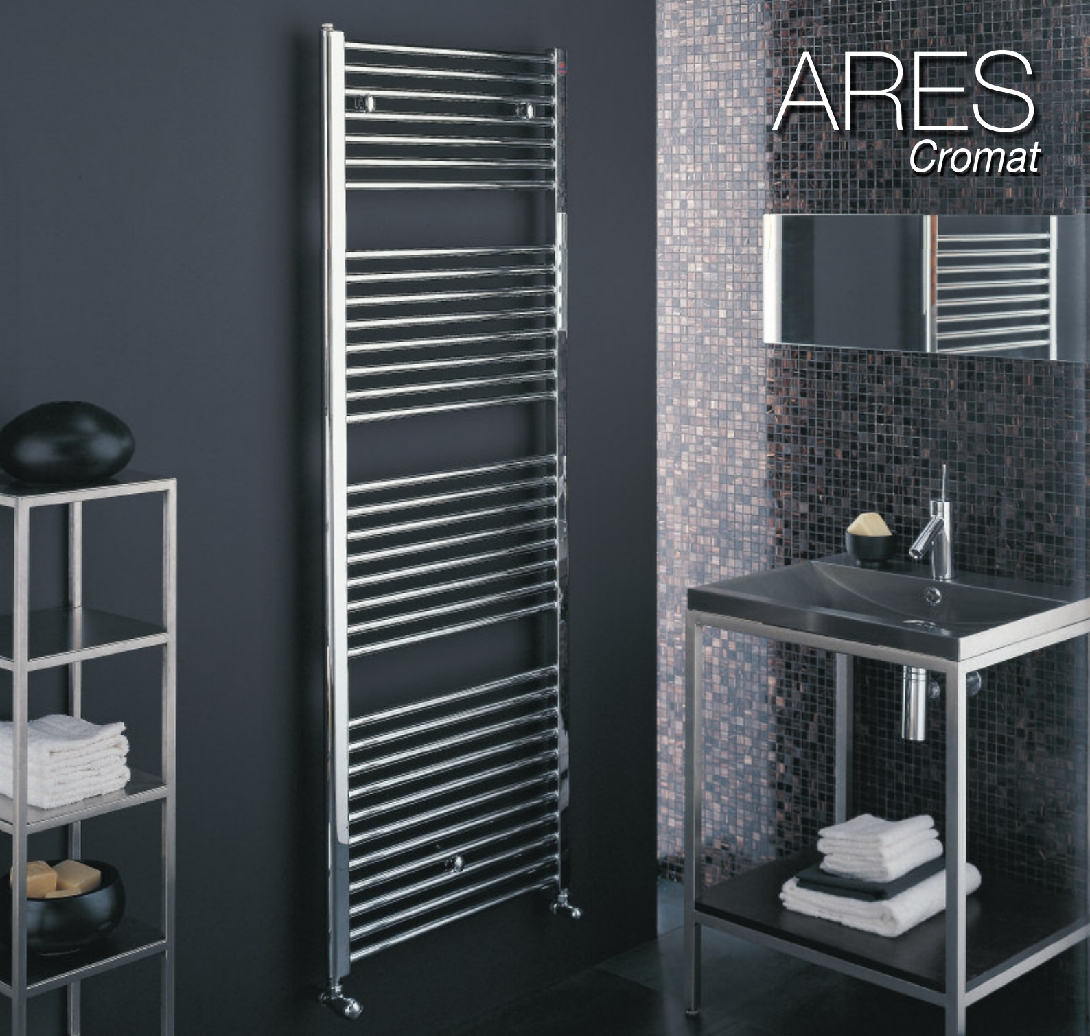
Calorifer Cromat (cod. 50)